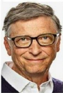
Bill Gates Globalista