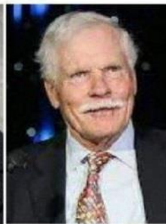
Ted Turner Globalista