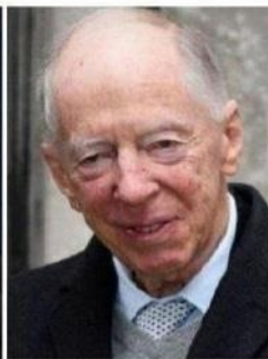
Jacob Rothschild Globalista