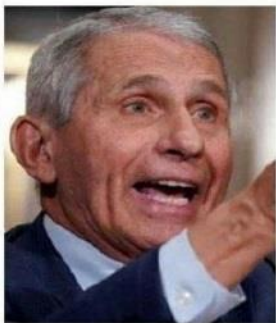
Dr Anthony Fauci Científico Globalista