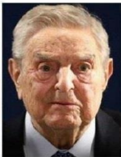
George Soros Globalista